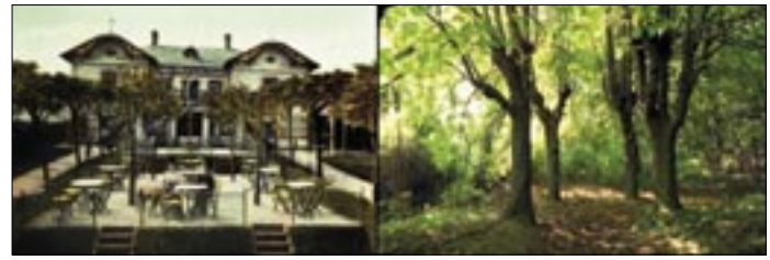
Von der einstigen Meierei im Wald (ca. 30m vor dem Waldeingang in der Maurer Lange Gasse führte ein Weg zu ihr) sah man 1991 noch diese Bäume. Lesen Sie dazu online Der Blick 1/2. S. 10.

Letzten Endes hat sich in den späten Zwanziger Jahren entschieden, dass aus Mauer keine Sommerfrische sondern ein attraktiver Wohnbezirk werden soll. Unter dem sehr ambitionierten Bürgermeister Franz Ruzicka wurde 1927 ein Großflugtag orga-