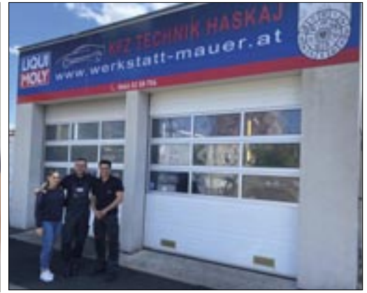
KFZ-Technik Haskaj, Reparatur aller Marken, Speisinger Straße 159, 1230 Wien, Tel. 0664/52 58 756. Lesen Sie bitte auf Seite 2!