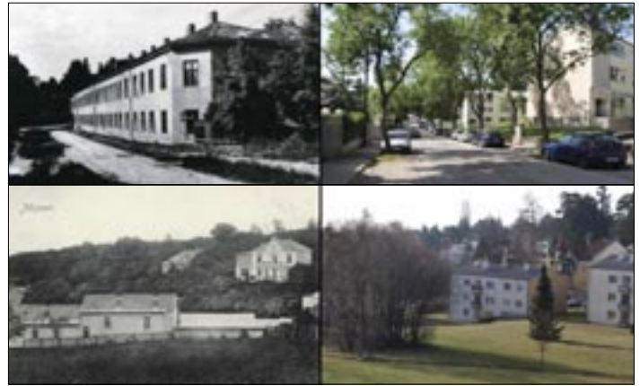
Aus heutiger Sicht war das Kurhaus in der Maurer Lange Gasse nicht sehr attraktiv. So passte dann auch der Name Mittelstandserholungsheim besser.

Gasse 59, das damals nur in den Sommermonaten bewohnt wurde. Vgl. Der Blick 1/3.S.4.). Und noch früher gibt es eine sehr positive Erwähnung: Schweickhart von Sickingen beschrieb Mauer 1831 als "wunderschön, an den mannigfachsten Abwechslungen überaus reich und wird daher von den land- und naturliebenden Städtern häufig besucht." Wenn auch der Ort damals noch vorwiegend ländlich war, werden auch schon "viele hohe Herrschaften" erwähnt, die in Mauer "geschmackvolle Landhäuser" besaßen. (Vgl. Der Blick 1/3. S. 6.) So viele können es aber nicht gewesen sein, haben 1831 doch nur