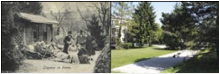
Erholung im Park für die Kurgäste in Mauer. Einige prächtige Edelkastanien von damals stehen auf der Liegenschaft Maurer Lange Gasse 136 heute noch.

Bilder u. Videos finden Sie auf https://mauer.at Beitrag Sommerfrische Mauer?