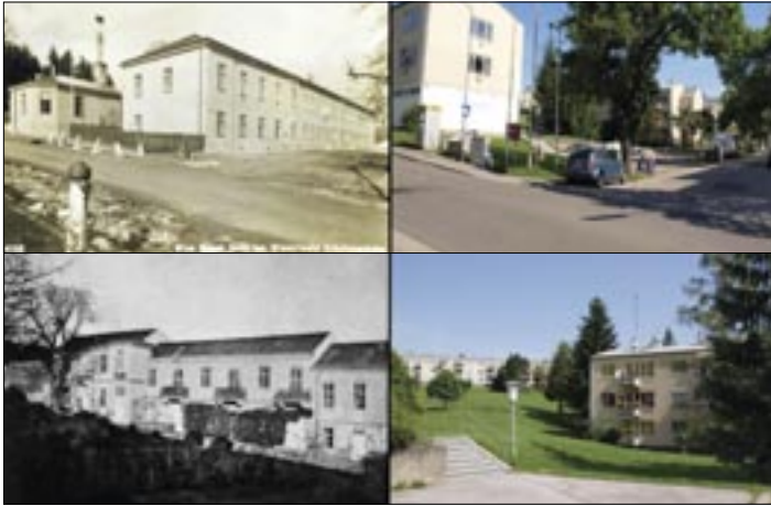
Die historischen Aufnahmen entstanden um 1930.

Der Begriff Sommerfrische ist heute aus der Mode, früher war er sehr beliebt. So wurde Mauer in einer "Allgemeinen Beschreibung der Gemeinde Mauer durch die Bezirkshauptmannschaft Hietzing-Umgebung" 1926 als "Sommerfrische und Wintersportplatz in Niederösterreich" ausführlich gewürdigt (vgl. Ing. Heinz Böhm: Chronik Schule Mauer. 3. Teil 1. S. 4.). Mauer war aber schon wesentlich früher eine beliebte Sommerfrische: Ludwig E. Thallmayer (geboren 1881) schrieb 1921 seine Erinnerungen an die Sommerfrische Mauer auf (seine Familie besaß von 1875 bis 1908 das Haus Maurer Lange