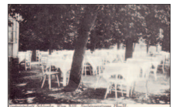
Das alte Hotel "Speising" am Stadtrand