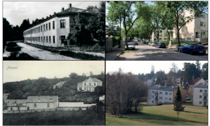
Aus heutiger Sicht war das Kurhaus in der Maurer Lange Gasse nicht sehr attraktiv. So passte dann auch der Name Mittelstandserholungsheim besser.

Gasse 59, das damals nur in den Sommermonaten bewohnt wurde. Vgl. Der Blick 1/3.S.4.). Und noch früher gibt es eine sehr positive Erwähnung: Schweickhart von Sickingen beschrieb Mauer 1831 als "wunderschön, an den mannigfachsten Abwechslungen überaus reich und wird daher von den land- und naturliebenden Städtern häufig besucht." Wenn auch der Ort damals noch vorwiegend ländlich war, werden auch schon "viele hohe Herrschaften" erwähnt, die in Mauer "geschmackvolle Landhäuser" besaßen. (Vgl. Der Blick 1/3. S. 6.) So viele können es aber nicht gewesen sein, haben 1831 doch nur