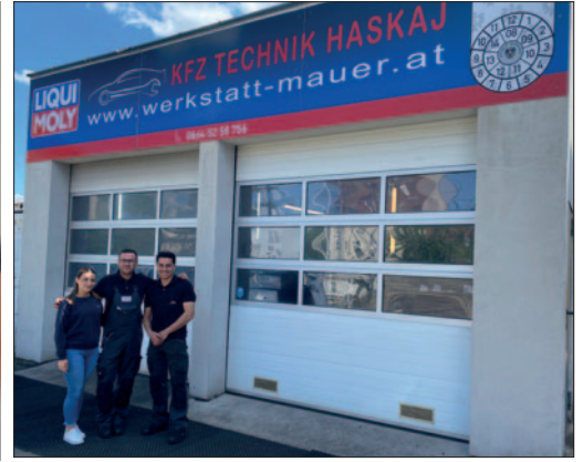
KFZ-Technik Haskaj, Reparatur aller Marken, Speisinger Straße 159, 1230 Wien, Tel. 0664/52 58 756 Lesen Sie bitte auf Seite 2!