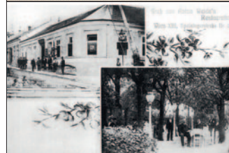
Das alte Hotel "Speising" am Stadtrand