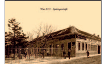
Das alte Hotel "Speising" am Stadtrand

In Speising gab es kaum Sommergäste, aber Gasthäuser. Im Uhrzeigersinn: Merk: Hier steht nun der Gemeindebau mit dem Postamt (schräg gegenüber der VHS); „Schlusche“ hat vor der Übernahme von „Weide“ oberhalb ein anderes Gasthaus betrieben; Cafe Mucha war gegenüber (leicht oberhalb) der jetzigen Waldzeile, nun steht hier eine Infobox für den Verbindungsbahnausbau. Gasthaus „Weide“, danach „Schlusche“, nun „Waldzeile“ am Beginn der Speisingerstraße; Fotos: Ing. Christian Gold