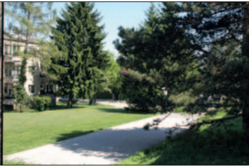
Erholung im Park für die Kurgäste in Mauer. Einige prächtige Edelkastanien von damals stehen auf der Liegenschaft Maurer Lange Gasse 136 heute noch.

Bilder u. Videos finden Sie auf https://mauer.at Beitrag Sommerfrische Mauer?