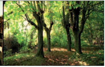
Von der einstigen Meierei im Wald (ca. 30m vor dem Waldeingang in der Maurer Lange Gasse führte ein Weg zu ihr) sah man 1991 noch diese Bäume. Lesen Sie dazu online Der Blick 1/2. S. 10.

nisiert, um seine Idee eines Maurer Flugplatzes zu befeuern, es gab im selben Jahr eine Wienerwaldausstellung, die in Mauer keine Wiederholung fand, Mauer wurde zur Marktgemeinde erhoben, um dann später doch ein Teil des 23. Wiener Bezirks zu werden und als man 1929 einen bemerkenswerten Fund aus der Jungsteinzeit machte, entschied man sich gegen ein Freilichtmuseum und für das Zuschütten des Fundes.