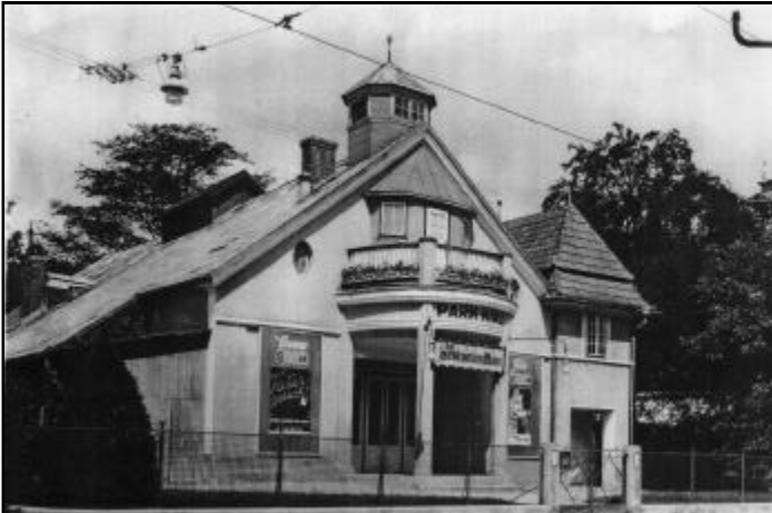
Das Maurer Kino war auch in den 60er-Jahren noch ein beliebter Treff der Maurerinnen und Maurer