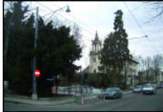
Bereich des Ölzelparks Ecke Ölzeltgasse und Geßlgasse, wo das Kino bis 1966 stand.

In den 30er-Jahren fanden auch viele Vortragsabende der