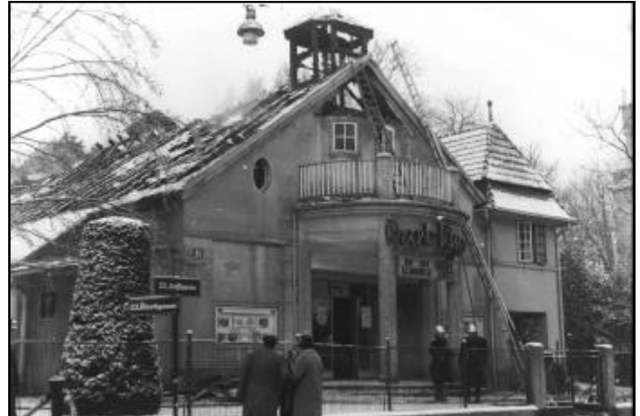
Am 10. Jänner 1966 wurde das Kino durch einen Brand so beschädigt, dass der Betrieb für immer eingestellt werden musste.