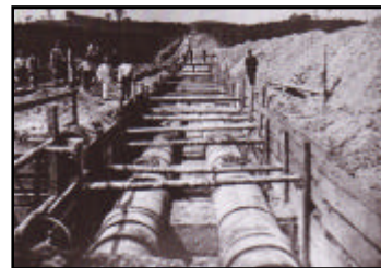
Baustelle einer Dükerleitung im Zuge der Wasserleitungsführung.

Am 15. Juli 1912 erfolgt die Inbetriebnahme des Neurologischen Krankenhauses Rosenhügel der "Nathaniel-Freiherr-von-Rothschild-Stiftung". Hand in Hand mit der Bautätigkeit erfolgt ein Ausbau des Verkehrs in den Randbezirken. Schon ab 1883 fuhr eine Dampftramway vom heutigen "Amtshaus" Hietzing über Lainz, Mauer, Rodaun bis Perchtoldsdorf. Anfang 1901 wird die Straßenbahnlinie 60 elektrifiziert und führt vorerst bis 1908 zur Jagdschlossgasse. Ab 1912 geht es elektrisch bis in die Gemeinde Mauer in Niederösterreich. Ein Besuch der Umgebung des Lainzer Tiergartens wird verkehrstechnisch immer leichter möglich; der Eintritt in das Habsburger Jagdrevier ist der Bevölkerung aber untersagt. Die "Schlucker"-Mauer steht als Grenze gegen Osten an der Wienerstraße (Speisinger Straße) und die Beamten des Linienamtes kontrollieren den Warentransport von Niederösterreich nach Wien. Den