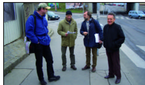
Agenda im Bezirk für Sie unterwegs!