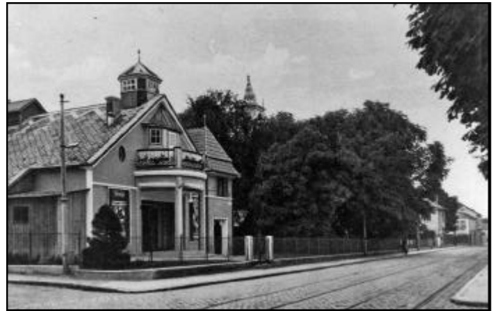
Der Baum an der Ecke vorne links war damals noch sehr klein. Der Turm des Parkcafes von Bäumen beinahe ganz verdeckt.