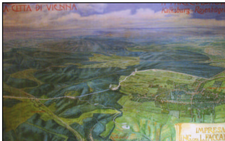
Gebiet Kalksburg - Wittgensteinstraße - Rosenhügel. Cav. Faccanoni-Ölgemälde.

"Hubertus" wird das Grätzl mit etwa 4000 Einwohnern genannt, dessen Grenzen mit denen des Pfarrgebietes der Kirche "St. Hubertus am Lainzer Tiergarten" identisch sind. Im Gegensatz zu anderen Bezirksteilen von Hietzing, die aus Vororten von Wien entstanden sind, hat sich dieses Gebiet aus 14 Siedlungen entwickelt. Jede dieser Siedlungen hat eine eigene Gründungsgeschichte, hat ein eigenes Gründungsdatum, jedoch eine Gemeinsamkeit: Alle befinden sich auf einem Territorium, das bis zum Anfang des 20. Jahrhunderts ein Teil des kaiserlichen Jagdgebietes Lainzer Tiergarten war.