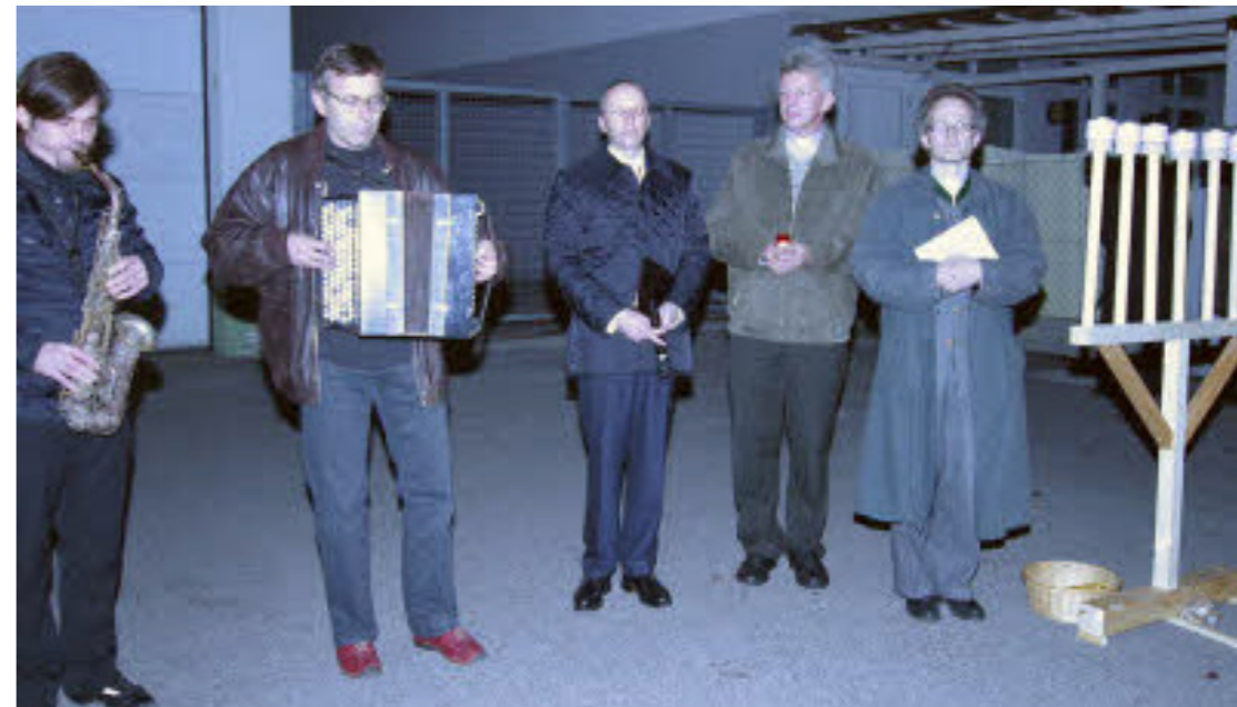
Bei einer Gedenkveranstaltung am 70. Jahrestag des Novemberpogroms wurde an die Opfer des NS-Regimes erinnert

Nach dem Krieg lag das Grundstück bis zur Errichtung eines Betriebsgebäudes brach. 1988 beschloss die Bezirksvertretung Liesing, eine Gedenktafel zur Erinnerung an die Synagoge zu errichten. Die Inschrift sollte in deutscher und auch in hebräischer Sprache abgefasst werden. Doch wurde dieses Vorhaben nicht umgesetzt, es