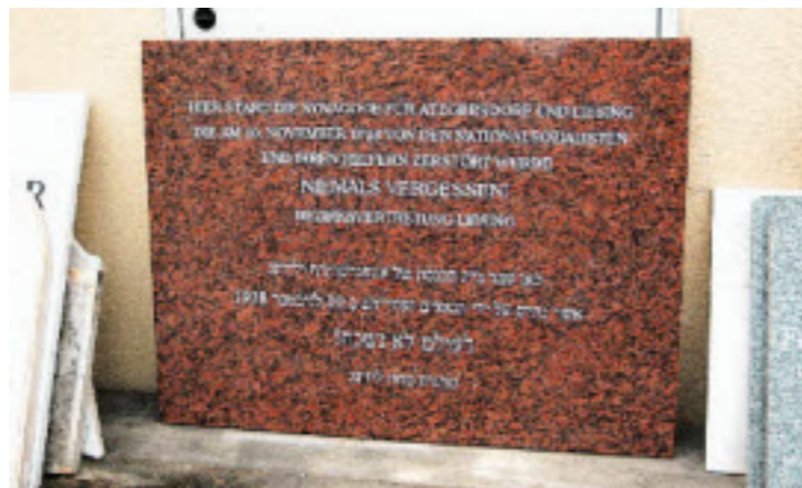
Diese Gedenktafel wurde im Jahr 2005 in der Dirmhirngasse angebracht

Die Fassade war im römischen Stil gehalten, einstöckig und von zwei kleinen Türmen mit Kup-